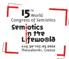
Рис. 1. Логотип XV Всемирного семиотического конгресса

XV Всемирный семиотический конгресс был организован Международной ассоциацией семиотических исследований (IASS-AIS) 1 совместно с Университетом Македонии (Салоники, Греция). Это было первое крупное международное научное событие, состоявшееся офлайн после пандемии COVID-19, оно привлекло более 500 участников со всего мира, которые с энтузиазмом вернулись к прерванной традиции живых встреч и дискуссий.